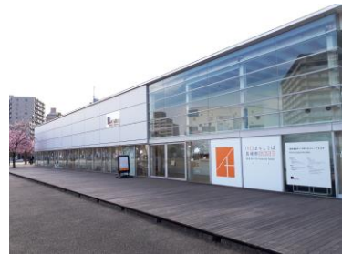
展示会場のアートギャラリー・アトリア

先月号でお知らせした川口まちこうば芸術祭2023が3/8～3/12まで開催され、晴天の下、延べ2500人を超える方にご来場いただきました。誠にありがとうございました。今月号では、展示された作品や会場の様子をお届けします。